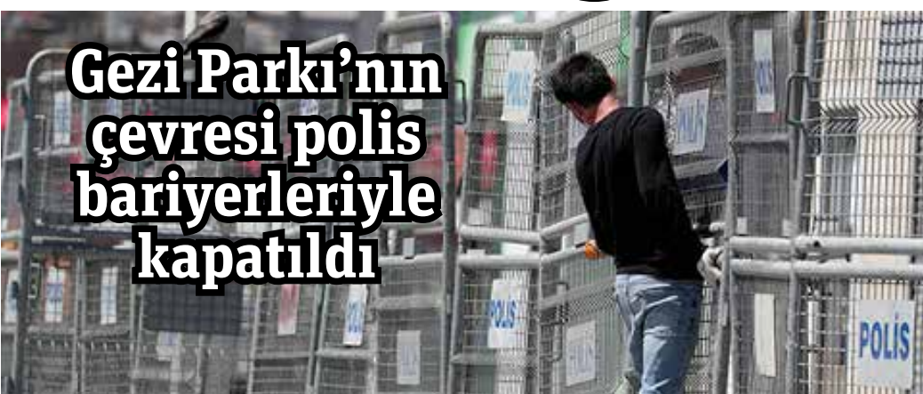
Gezi olaylarının 7. yıl dönümünde de polis geniş güvenlik önlemi aldı. Parkın etrafına polis bariyerleri konuldu, parka giriş-çıkış kapatıldı.

27 Mayıs'ta akşam 10 sularında iş makineleri Topçu Kışlası için Gezi Parkı'na geldi. Bir duvar yıkılırken 5 ağaç söküldü.