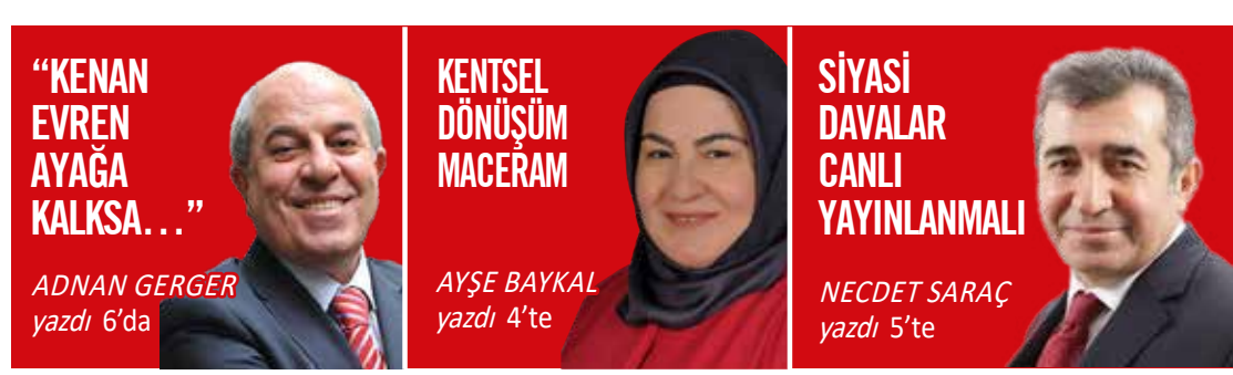
"KENAN EVREN AYAGA KALKSA..." ADNAN GERGER yazdı 6'da